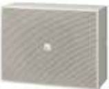
BS-P678IP1/BS-P678E 网络壁挂扬声器/壁挂扬声器